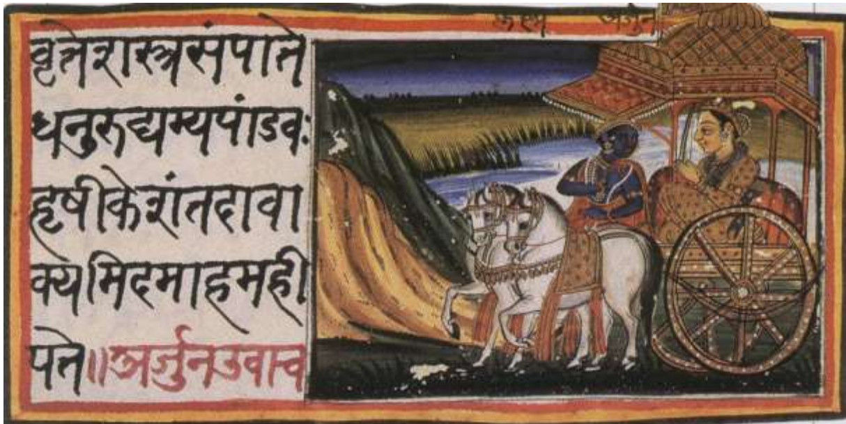
Escena del Bhagavad Gita : Krishna guía el carro del guerrero Arjuna

El Ramayana nos explica la historia del gran rey Rama. El nacimiento y las gestas de Krishna se encuentran en el Bhagavata Purana (también conocido como Srimat Bhâgavatam ). Krishna desempeña también un importante papel en el Mahabharata , un extenso poema épico. Todos ellos son bellos y ricos textos, poéticos y sabios, que nos ofrecen multitud de indicaciones que invitan a la investigación.